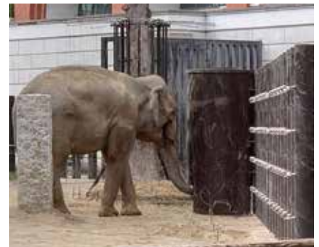
自動給餌装置から餌を食べる象

2つ目は餌を与える時間をランダムに設定できるようにしたこと。また、あえて象が餌を「取りづらい」構造にしました。これは象の生態を尊重することが目的です。本来、野生の象は一日の大半を餌探しと食べることに費やしています。これが、動物園での定時の餌やり慣れしてしまうと、自然と反する生活のためかストレスから「常道行動」(同じ動作を繰り返したり同じ場所を行ったり来たりする行動)が見られるようになります。ランダムな時間の給餌と、また餌を取るのも簡単に取れないようにすることで、象の自然な生態に近づけることを目指しました。