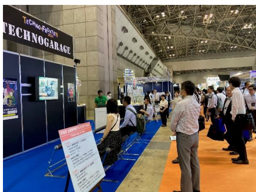
主催と連携した企画展「テクノガレージ」